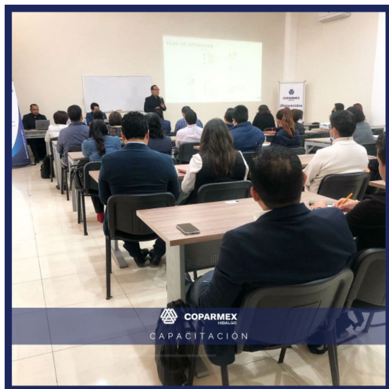
COPARMEX HIDALGO CAPACITACIÓN

El día martes 21 de marzo, se llevó a cabo nuestra plática informativa titulada; “Aclaraciones Patronales, Portal Empresarial Servicio de Intercomunicación de Avisos.”, donde nuestros socios participantes resolvieron sus dudas.